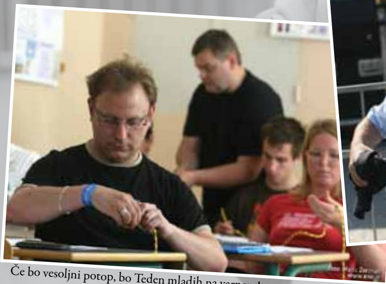
Če bo vesoljni potop, bo Teden mladih na varnem!