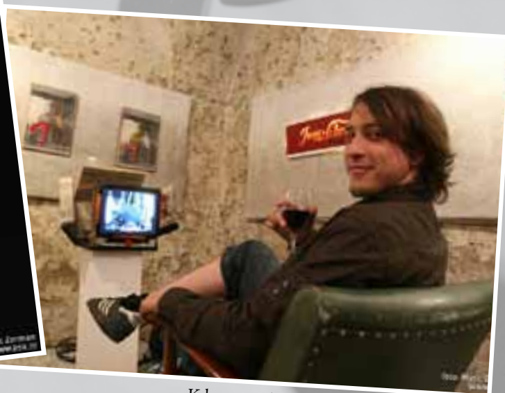
Kdo pravi, da je umetniško življenje težko?