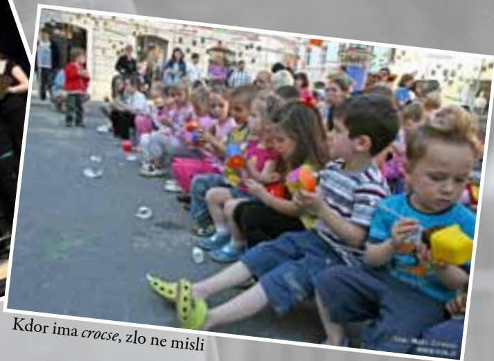
Kdor ima croce , zlo ne misli