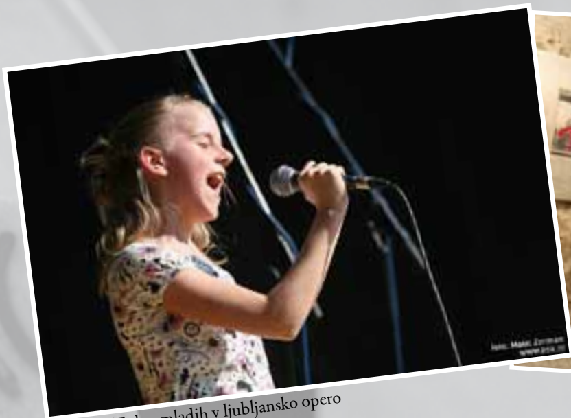
Z odra Tedna mladih v ljubljansko opero