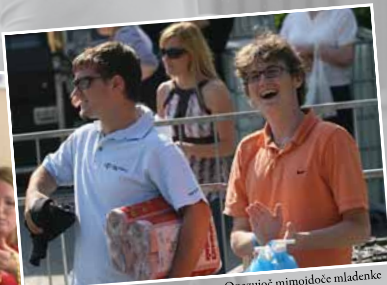
Opazujoč mimoidoče mladenke