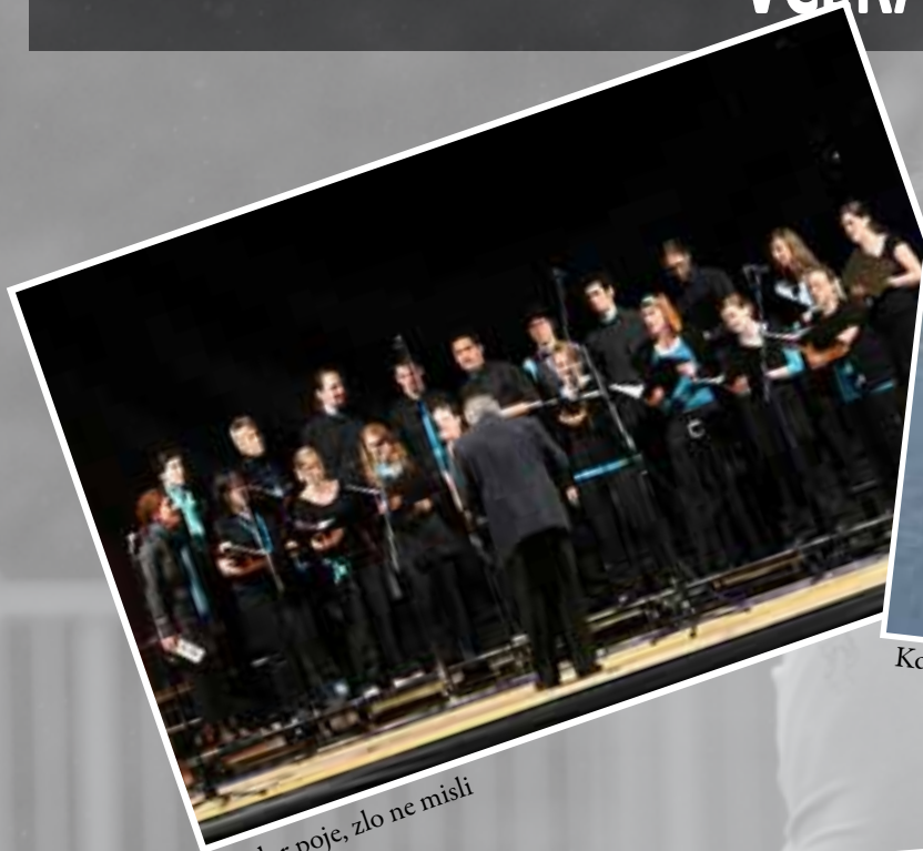
Kdor poje, zlo ne misli