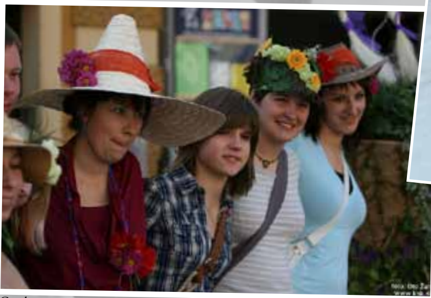
Cvetke na razstavi cvetličnih oblek