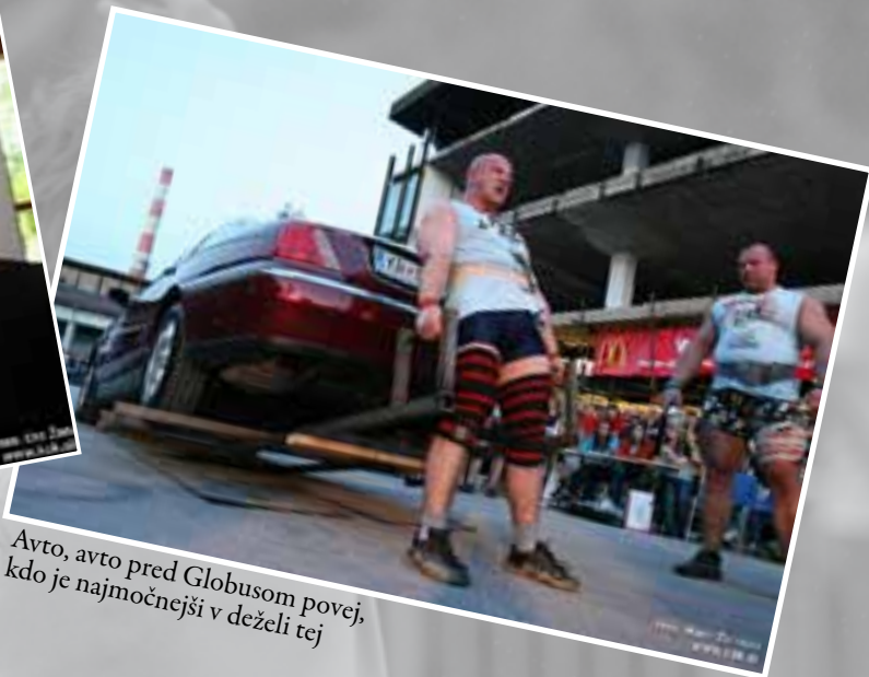
Avto, avto pred Globusom povej, kdo je najmočnejši v deželi tej