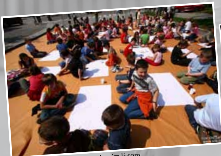
Tudi Picasso je začel z neporisanim listom.