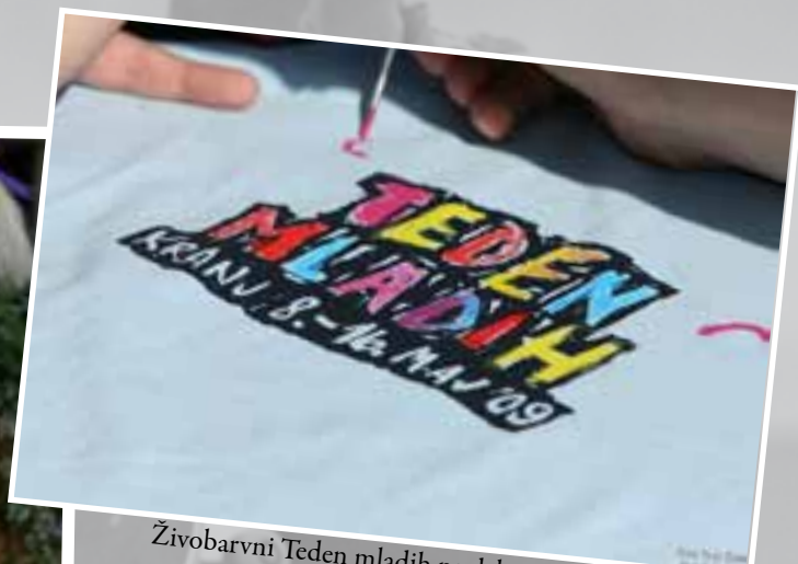
Živobarvni Teden mladih na delavnicah slikanja majic Pobarvaj si sam!