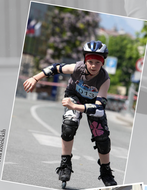
Robot na kolesčkih