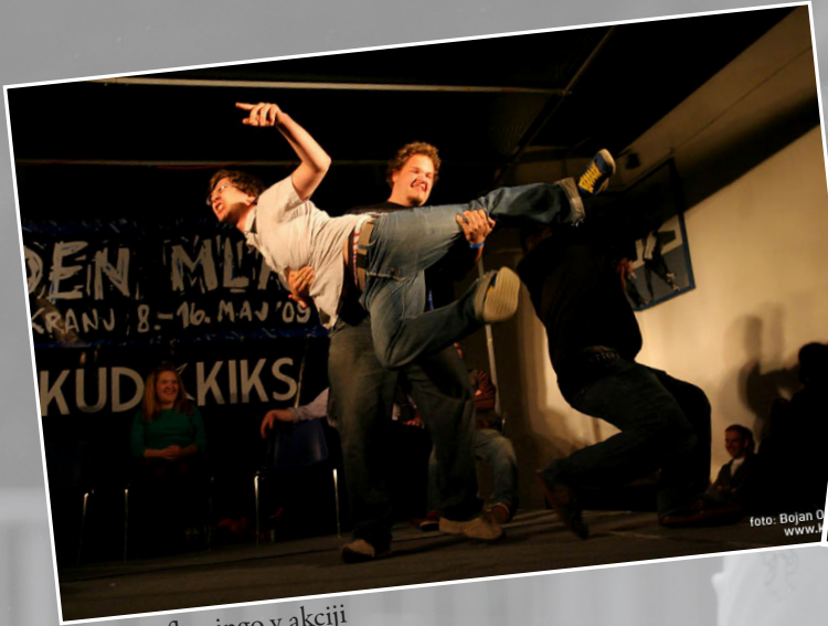
Leteči flamingo v akciji