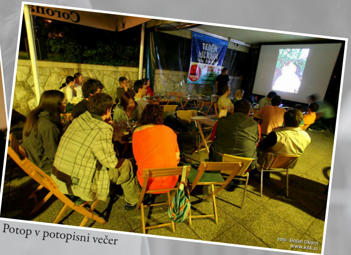
Potop v potopisni večer