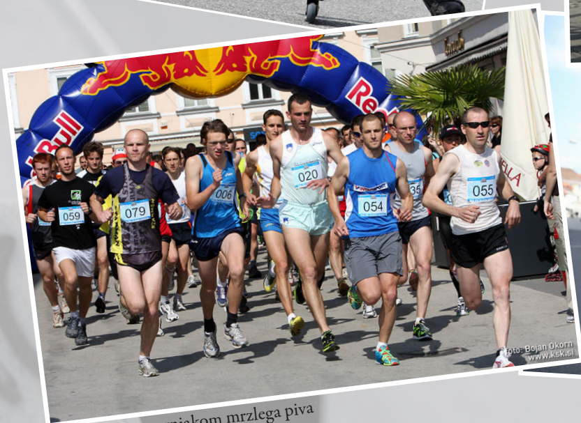
Tečejo za tovornjakom mrzlega piva