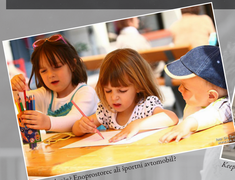
Kaj je lepše? Enoprostorec ali športni avtomobil?