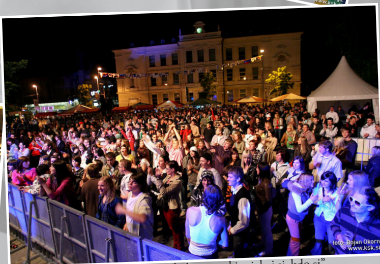
"Tole gre od ljudi za ljudi, ne glede na to, kje si, kaj si, kdo si"