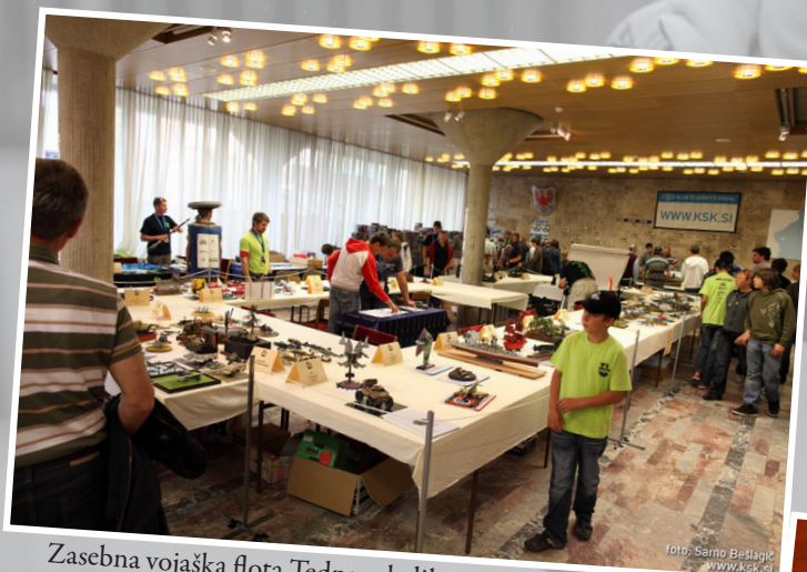
Zasebna vojaška flota Tedna mladih - čeprav zgolj v maketah