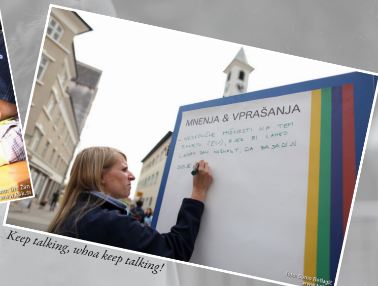
Keep talking, whoa keep talking!